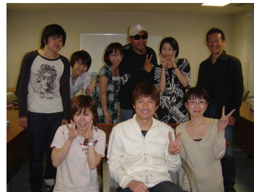
中央奥がケイ・グラント